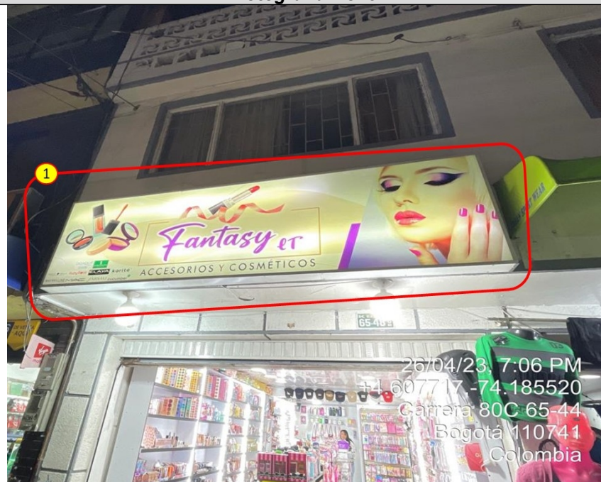
Fotografía No. 3

Elemento de publicidad tipo aviso en fachada, el cual no cuenta con registro de publicidad exterior visual de la SDA.